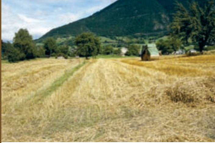
Die «Achera Biela» nach der Ernte

Noch bis nach dem Zweiten Weltkrieg war der Brigerberg mit den beiden Ortschaften Termen und Ried-Brig von der Landwirtschaft dominiert. Rings um die geschlossenen Haufensiedlungen breitete sich das Wies- und Ackerland aus. In Ried-Brig waren die Dörfschaften Lowina, Schlüocht und Ried klar von einander abgegrenzt. Ab den 1960er Jahren setzte jedoch ein starker Wandel ein. Immer mehr Personen der beiden Gemeinden pendelten zur Arbeit nach Brig oder in andere Talgemeinden. Umgekehrt entdeckten zunehmend Leute aus Brig-Glis die vorzügliche Wohnlage des Brigerbergs. In Termen stieg die Bevölke-