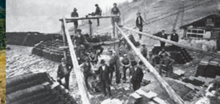
Das Schieferlager mit der Transportbahn der Termer Schieferbrüche

In Brig war im Sommer 1910 die international ausgeschriebene