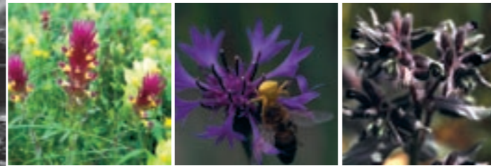
Acker-Wachtelweizen (Melampyrum arvense) Kornblume (Centaurea cyanea) Braunes Mönchskraut (Nonea pulla)

Mit dem Aufkommen des Eternits war die teure und aufwendige Handarbeit des Schieferabbaus nicht mehr konkurrenzfähig. Am 14. Juli 1972 stellte die «Simplon-Schiefer AG» den Schieferabbau ein, und bei der General-