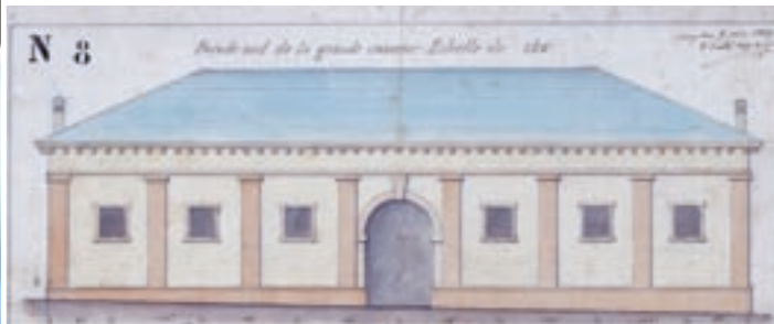
Umbauplan (1859) der «Alten Kaserne» zur Truppenunterkunft

Der nach 1670 von Kaspar von Stockalpererbaute fünfgeschossige, turmartige Mauerbau diente dem Handelsherrn als Sust so-