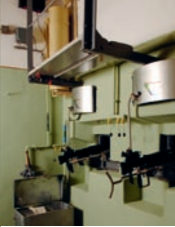
MG-Stand und Maschinenraum im Fort Gondo

Die «Alte Kaserne» ist um 1805 im Zusammenhang mit dem Bau der napoleonischen Militärstrasse über den Simplon entstanden. Die Fälldaten der Dachsparren datieren gemäss dendrochronologischer Untersuchung aus den Jahren 1805 und 1807. Architektonisch ist die «Alte Kaserne» eines der interessantesten und wertvollsten Gebäude, das die napoleonische Zeit am Simplon hinterliess. Sie sollte als Truppenunterkunft dienen, und ihre Erbauung stand vermutlich in einem Zusammenhang mit der vorgesehenen, aber – be-