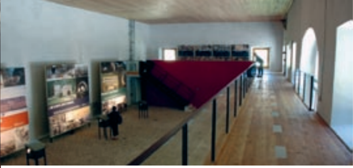
Ausstellungsraum in der «Alten Kaserne»

Bereits beim Bau der Strasse planten die Generäle Napoleons, den Simplon zu befestigen und in den Felsen der Gondoschlucht gegen-