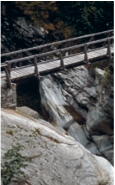
Holzstege des Stockalperweges im Zwischbergental

den hatte, förderte in der Folge die Ansiedlung von Oberwalliser Familien. Die zu Beginn des 14. Jahrhunderts im deutschsprachigen Wallis einsetzende Auswanderungswelle kam ihm dabei sehr gelegen. Während die Historie die Ursachen der Emigration auf Überschwemmungen im Rhonetal und eine Überbevölkerung in den Dörfern zurückführt, erzählt die Sage von ungerechten Herrschaftsverhältnissen und Willkür. Nachdem sich die Natischer jahrelang unter dem Joch eines Tyrannen gebeugt hatten, der ihnen nicht nur einen hohen Tribut auferlegt, sondern auch ihre Vorräte geplündert hatte und obendrein das Erstlingsrecht auf jede frisch vermählte Braut geltend machte, probten die jungen Leute den Aufstand. Nachdem sie den Wüstling getötet hatten, feierten die jungen Paare unbeschwert Hochzeit. Schon bald zeichnete sich neues Unheil ab. Benachbarte Burgherren rückten gegen Naters vor, den Tod in Schloss Unravas zu rächen. Doch die jungen Paare waren mitsamt ihren Freun-