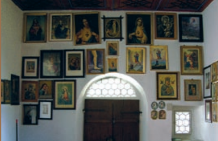
Eingangswand der Kapelle «Maria Bru» mit Votivgaben