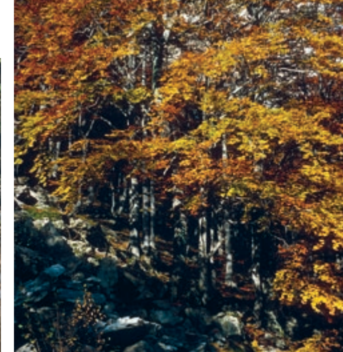
Herbstliche Buchen im vorderen Zwischbergental

Nach dem tragischen und zerstörerischen Ereignis, bei dem am 14. Oktober 2000 ein Erdbeben in Gondo 13 Menschen in den Tod gerissen und Teile des Dorfes zerstört hatte, kehrten viele Einwohnerinnen und Einwohner nach dem Wiederaufbau des Dorfes nicht mehr nach Gondo zurück. Im Frühjahr 2010 zählte die Gemeinde noch eine Bevölkerung von 100 Personen. Im Schuljahr 2006/07 musste die Dorfschule schliessen.