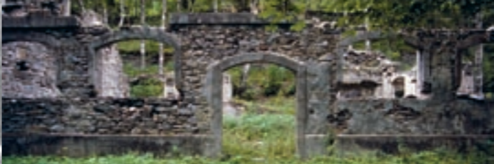
Ruine eines Werkgebäudes auf dem Minenboden

Die Familie Stockalper trat 1840 ihre Konzession einer französischen Gesellschaft ab. Gross ins Geschäft stieg aber erst die am 16. Februar 1875 gegründete «Société anonyme des Mines d’Or de Gondo» ein. Auf dem Höhepunkt des Goldrausches von Gondo übernahm im Frühjahr 1894 die in Paris domizilierte «Société des Mines d’Or de Gondo» die Anlage. Bauleute, Mechaniker, Mineningenieur waren im Talgrund beim Weiler Staldenbeschäftigt, wo auf dem «Minenboden» die Verhüttungsanlage entstand: eine damals hochmoderne Installation mit Pochwerken und Gesteinsmühlen, angetrieben durch Wasserkraft und Elektrizität. Und hoch oben in den schroffen Felswänden schürften die Bergarbeiter in den Stollen und Galerien nach dem Gold, schieden das «taube» Gestein vom erzhaltigen und transportierten das Erzgestein mit einer für die damalige Zeit fast revolutionären Erfindung – mit einer Seilbahn – zum Verhüttungsplatz im Talgrund. Nur einen Steinwurf von der Verhüttungsanlage entfernt, residierte die Direktion in einem vornehmen Haus.