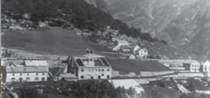
Verhüttungsanlage des Goldbergwerks im Zwischbergental (um 1920)

Bei den Buchenwäldern der Simplon-Südseite handelt es sich um den Hainsimsen-Buchenwald. Dieser Buchenwald ist ausschliesslich auf saurem Boden anzutreffen und ist eine typische Vegetationsgesellschaft der Südalpen. Bei Gondo wachsen im Unterwuchs hauptsächlich die Schneeweisse Hainsimse und vereinzelt der Adlerfarn. Typische Vertreter der Flora der Buchenwälder sind auch der Waldmeister oder an etwas schattigeren Orten der Bärlauch. Daneben kommen im Buchenwald des Zwischbergentals auch noch etliche Elemente der insubrischen Flora vor. So zum Beispiel das Rote Labkraut oder das Gaudins Laserkraut. Als besondere Seltenheit für das Wallis ist auch das Gemeine Alpenveilchen im Buchenwald bei Gondo vertreten.